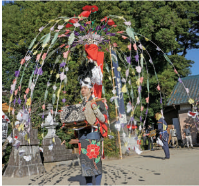
実際のまつりの様子 上：円座羯鼓踊（伊勢市） 下：勝手神社の神事踊（伊賀市）

で、胸にかんこと呼ばれる桶胴太鼓を付けてたたきながら集団で踊ります。ただ、装束や伝承されている曲も地域によって全く異なります。三重の多様なかんこ踊りの姿を見ていただければと思います。伊賀の勝手神社の神事踊（伊賀市）は、ユネスコ無形文化遺産「風流踊」に登録されています。