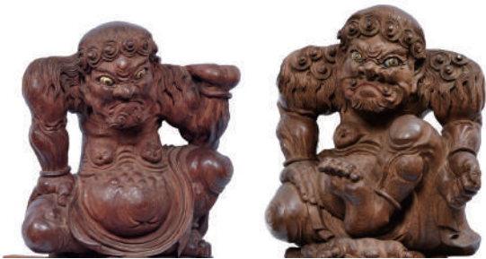
西船馬町石取祭祭車彫刻 力神 桑名市指定有形民俗文化財