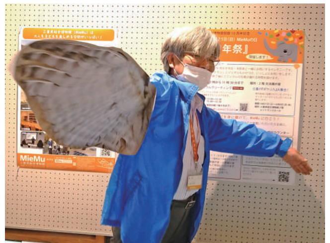
羽ばたいていく館長 （「さわって体験する鳥の体のひみつ」 アウトリーチキットのワークショップで）