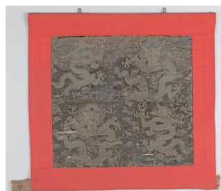
上野西町楼車前幕「雲龍文」（後期展示）

福田 ：これらの幕は江戸時代に制作されたもので楼車蔵などにしまわれているため、普段は地元の方も見ることはほとんどありません。ほぼすべての引退幕の調査・撮影、保存会を9町すべての協力を得て、行うことが出来ました。例えば、上野西町の雲龍文の幕があるのですが、かなり前から使われていない幕で、一般的に「蝦夷錦」とよばれている中国からもたらされた布を使ったもので