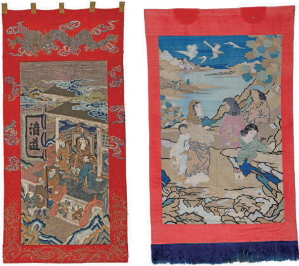
左：上野小玉町楼車見送幕「朝鮮通信使図」（前期展示） 右：上野新町楼車見送幕「蘭人嬉遊図」（後期展示）