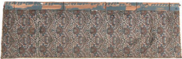
上野福居町楼車天水水引幕「雲龍図」 上：表 下：裏

あろうことはおぼろげながらわかっていました。しかし、今回詳細に調査したところ、素材に清朝初期の高位の官人の官服が仕立て直されたものが使われており、大変貴重なものであることがわかりました。