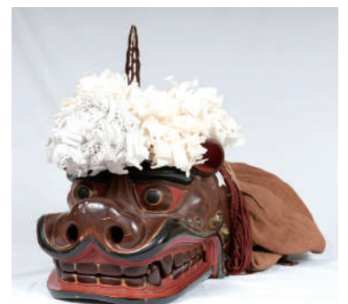
茜社獅子頭 三重県指定有形文化財