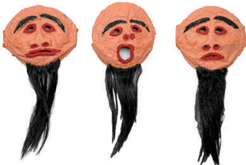
上：津八幡宮祭礼の唐人面（石水博物館 唐人踊面） 中：旧久居町の練物の唐人 （個人蔵 旧久居城下町の練物絵巻・前期展示後期展示で場面替あり） 下：東玉垣町唐人踊りの面（東玉垣町第一自治会）

いました。これらの調査は、地域の皆様のご協力がなければ実現不可能なものでした。これらの写真などは図録に掲載しております。