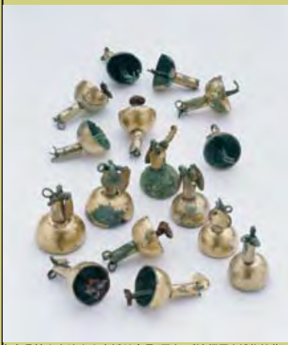
奈良県植山古墳出土土歩揺付金具(歴史に憩う橿原市博物館蔵)