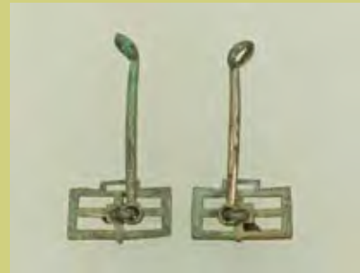
三重県伊勢市塚山古墳出土 長方形鏡板付嚢(東京国立博物館蔵) ※