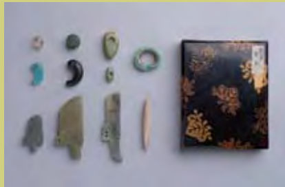
松浦武四郎旧蔵資料 馬角(静嘉堂文庫美術館蔵)