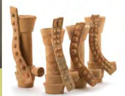
大阪府今城塚古墳出土大刀形埴輪(高槻市立今城塚古代歴史館蔵)