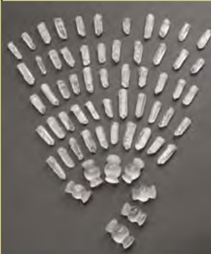
三重県薬師谷14号墳出土 水晶原石・三輪玉(津市埋蔵文化財センター蔵)