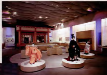
展示室 I ▶

常設展示では、文献や文学からさぐる齋王・齋宮の世界、そして齋宮跡の発掘調査が解き明かす齋宮のすがたを紹介しています。