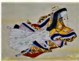
▲三十六歌仙図画帖より中務(当館蔵)

斎王をはじめとする平安時代の姫君たちはどのような服装をしていたのでしょうか？目まぐるしく変わる現代のファッションのトレンドのように、古代の人々もおしゃれを楽しんだのでしょうか？古代の衣装や、装いのための道具類により、当時の人々が「よそおう」ことをどのようにとらえていたかなどについて紹介します。