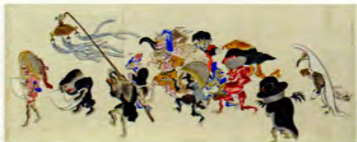
百鬼夜行絵巻▶(当館蔵)

いにしへの時代から人々を悩まし続けた人知を超える現象や不可思議な力。災いをもたらすとも、神の使いとも考えられていた闇の中に存在する不可思議な者たち。人々は闇の中に何を見たのか。齋宮を取り巻く社会環境や風俗を紹介します。