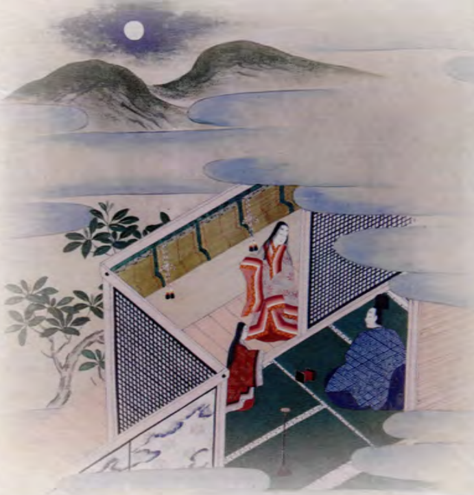
伊勢物語絵巻(齋宮歴史博物館蔵)