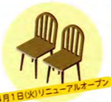
4月1日(火)リニューアルオープン

オールハンドメイドの個性豊かな三重の木の椅子とテーブルたちが、皆様をお迎えます。三重県産の木の温みある空間で、グループでもおひとりでもくつろいでいただけます。皆さまぜひお越しください。