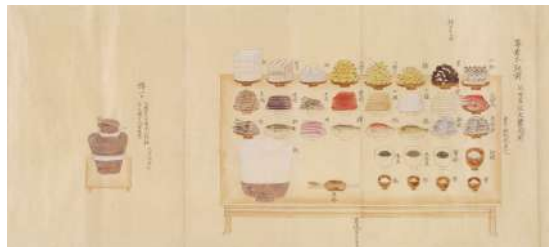
上段左から 餓鬼草紙、春日権現霊験記、三節会御膳図 (以上 京都市立芸術大学芸術資料館蔵) 下段左から 厨事類記 (西尾市岩瀬文庫蔵)、 類聚雑要抄図巻 (齋宮歴史博物館蔵)