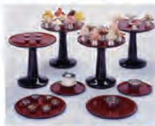
齋王の食事(模型・当館蔵)

常設展示室のトピックを掘り下げるシリーズの第4弾です。今回は、齋王をはじめ、平安時代の人々はいつ、どんな時にどんなものを食べていたのか、記録や絵画資料などから紹介する企画です。