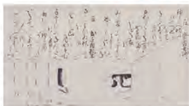
時代不同歌合絵巻断簡 齋宮女御・式子内親王(当館蔵)

中世の齋宮は、齋王制度の衰退・廃絶期とされ、あまり注目されてきませんでした。源平の争乱を経て鎌倉幕府が成立するなど、激動の時代であった中世における齋王制度の様相と廃絶にいたる要因を齋王たちの動向とともに探ります。