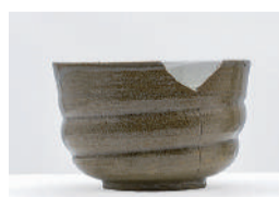
津城跡から出土した安東焼の碗

2025年3月8日(土)～4月20日(日) 近年、三重県内で行われた発掘調査の成果を、遺跡の出土品、写真、解説パネルを通して紹介します。ふるさと三重の歴史解明につながる最新の調査成果に触れ、文化財のもつ本物の魅力を感じていただきたいと思ひます。