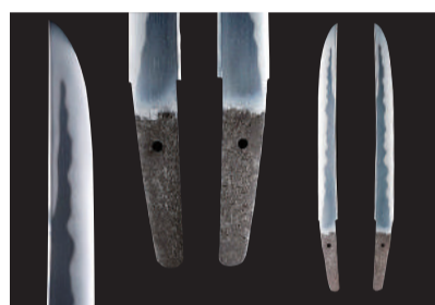
脇差 銘(表)濃州御勝山麓藤原永貞 (裏)於伊勢田丸作之 萬延元年九月日 江戸時代末期 個人蔵

基本展示とのセット観覧券 一般セット券：1,050円(840円) 学生セット券：630円(500円)