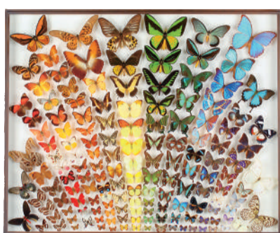
チョウの色と形の多様性

基本展示とのセット観覧券 一般セット券：1,050円(840円) 学生セット券：630円(500円)