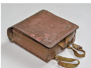
紙製のランドセル

7月20日(土)～8月25日(日) 当館が所蔵する戦争関連資料の中から、雲井コレクションを中心に当時の国民生活がわかる資料を紹介します。今回は物資不足を補うための代用品を取り上げます。