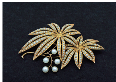
ブローチ「楓」 ミキモト真珠島 真珠博物館蔵