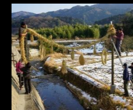
岡鼻のカンジョウナワ