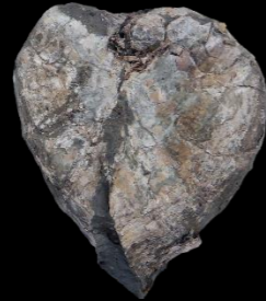
オクヤマドブガイ