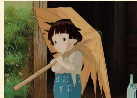
「火垂るの墓」(1988年)より ©野坂昭如/新潮社,1988