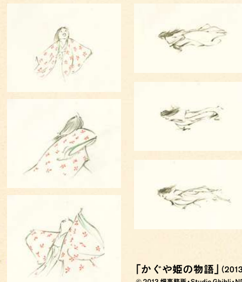
「かぐや姫の物語」(2013年)より

描いてない部分があるとか、ラフなタッチのままだとか。 そしてそれが、とりもなおさず、見る人の心に 記憶を探ろう、想像しようという気持ち呼び覚ますんだと思うんです。 「かぐや姫の物語」での線の途切れ・肥瘦、塗り残し、がたつきなどは、 そのために役立ったのではないのでしょうか。