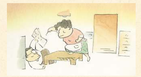
「ホーホケキョ とりの山田くん」(1999年)より ©1999 いしいひさいち・畑事務所・Studio Ghibli・NHD

映画監督・高畑勲(1935~2018)は、現在の伊勢市に生まれ、幼い時期を津市で過ごしました。本展は、三重ゆかりの映画人である高畑にスポットをあて、絵を描かない監督がどのようにして歴史に残るアニメーションをつくったのか、他のクリエイターたちとの交流や共同制作の過程を通して明らかにします。