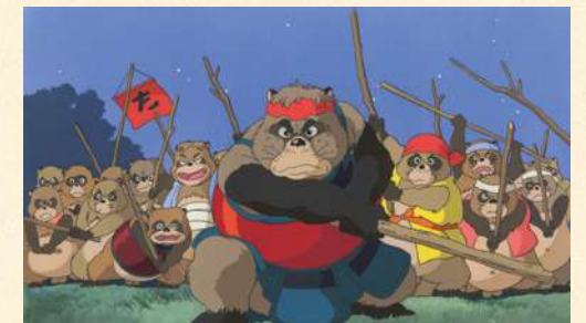
「平成狸合戦ぽんぽこ」(1994年)より

日本人が日本のアニメーションを作る、とはどういうことか、 いつも考えていました。