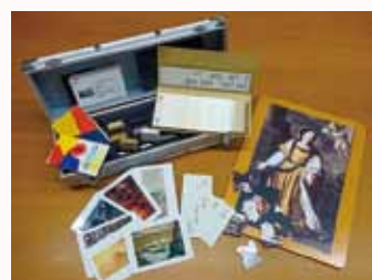
アートカードみえ*

三重県立美術館所蔵の作品図版を素材にした、美術鑑賞教育支援教材「アートカードみえ」の貸し出しを行っています。所蔵品画像を使ったアートカードをはじめ、大判のパズル等、楽しみながら作品に親しむための教材セットです。教材の使い方や作品解説を載せたガイドブックも教材と一緒に貸し出します。図工・美術科の鑑賞授業や、団体鑑賞の事前授業としてお役立てください。