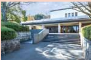
正面玄関前おもいやり駐車場