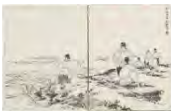
『神都名勝誌』巻五より 賀海神事御覽取之図 (当館蔵)

古来、人やモノの交流、移動は、陸路のみならず海路によっても行われていました。人々が織りなすさまざまな活動の成就や平安な世を願う想い、感謝の気持ちをどのようにして神々に伝えていたのかを「海」と「神社」という視点から紹介します。