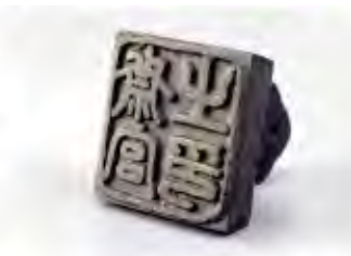
銅印「斎宮之印」(横造) (当館蔵)

常設展示室のトピックを掘り下げるシリーズの第3弾です。今回は、伊勢・斎宮の地で暮らす斎王を支えた組織「斎宮寮」をテーマに、斎宮寮の成立からその組織、運営、研究史に至るまで、様々な角度から斎宮寮について迫ります。