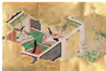
源氏物語絵巻 朝顔 (当館蔵)

日本には、一年を通して様々な花が咲いています。人びとは、四季折々の花を、古来より歌に詠んで思いを託し、宴をひらいて愛でてきました。平安時代に斎宮を彩った花とともに、いにしえより続く花を愛でる文化を紹介します。