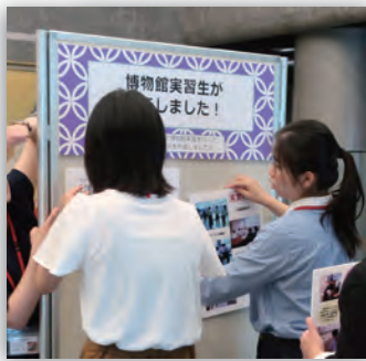
昨年度の実習の様子