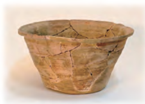
齋宮出土の植木鉢？

齋宮での園芸や植栽は、平安時代に齋宮の外周にマツやヤナギを列植したこと以外は知られていません（『延喜式』）。しかし、春にはヤマザクラやウメなどの花樹、「重陽の節句」（9月9日）の際にはキクの花が愛でられていたかもしれません。さらに、齋宮寮庁のあった柳原地区（史跡公園「さいくう平安の杜」のある場所）とその周辺では、11世紀の植木鉢あるいは盆栽の鉢の可能性のある陶器が出土しています。平安時代齋宮の園芸文化の可能性を探ります。