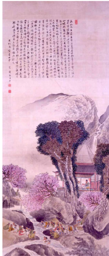
月僊《蘭亭曲水図》1806(文化3)年