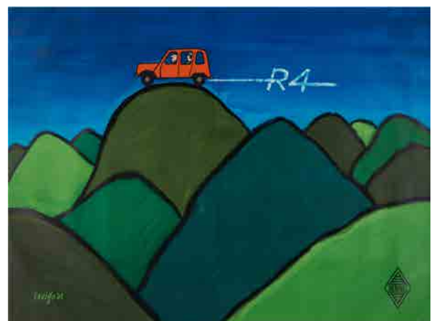
⑪《ルノー4》1963年、ティエリー・ドゥヴァンク・コレクション © Annie Charpentier 2018