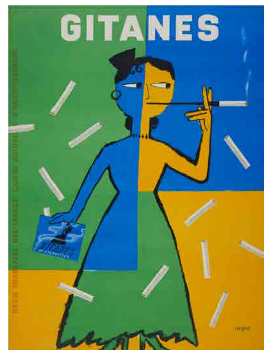
⑨《ジターヌ》1954年、パリ市フォルネー図書館所蔵

サヴィニャックのポスターを参考に、食べものや商品のイメージに色紙を貼ったりキャッチコピーをつけたりしながら、ユーモアたっぷりのデザインをつくってみましょう。