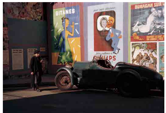
⑦木村伊兵衛《ポスターのあるパリ風景》1954年、2017年リプリント 写真（ゼラチンシルバートリント）木村・田沼コレクション 写真：木村伊兵衛

本展では、実物のポスターに加えて、木村伊兵衛らによる当時の景観写真を展示し、サヴィニャックのポスターがパリの街角をいかに彩ったかをご覧ください。また、作家の生い立ちや素顔がかいま見える写真や、アトリエに残されていた道具類といった様々な資料を通して、作品だけでなくサヴィニャックの人となりに触れていただける展示です。