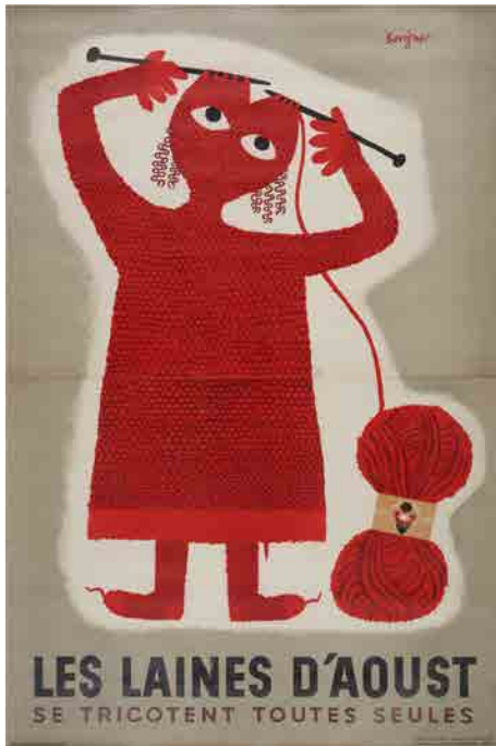
②《ひとりでに編める ウット毛糸》1949/1951年、 パリ市フォルネー図書館所蔵 © Annie Charpentier 2018

フランスを代表するポスター作家であり日本にも多くのファンをもつレイモン・サヴィニャック（1907-2002）のかつてない大規模個展が、この夏、三重にやって来ます。