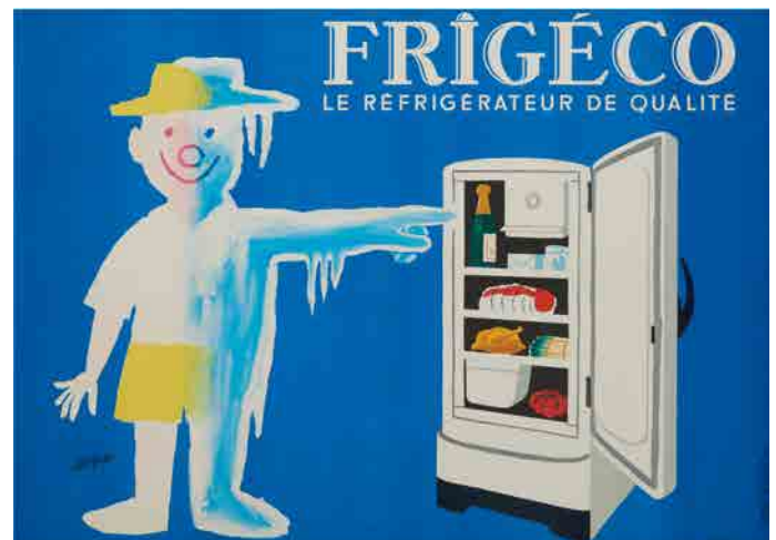
⑥《フリジェコ：良質の冷蔵庫》1959年、パリ市フォルネー図書館所蔵 © Annie Charpentier 2018

主にフランスの所蔵者よりお借りした200点あまりの作品を、年代順ではなく10のセクションに分けて楽しく紹介します。「動物」、「子ども」、「働くヒト」といった作家の定番のモチーフに加えて、「指さすヒト」や「製品と一体化したヒト」といった表現方法、「ビック」「自動車」などの製品ごとに作品を展示し、「どのようにメッセージを伝達するか」を視覚的に追求した本作家独自のグラフィック手法に迫ります。