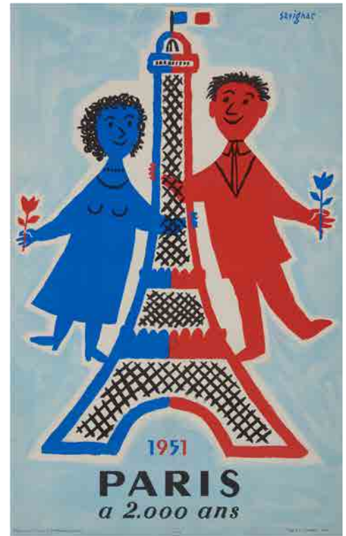
⑩《1951年、パリ誕生2000年記念》1951年 パリ市フォルネー図書館所蔵 © Annie Charpentier 2018

※託児サービスの申込方法やスペシャルランチの詳細は、美術館ウェブサイトをご覧ください。