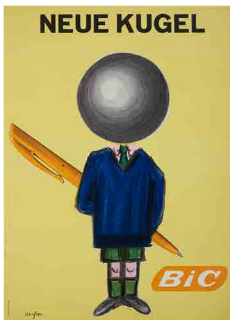
④《ビック：新しいボール(スイス版)》1960年、パリ市フォルネー図書館所蔵