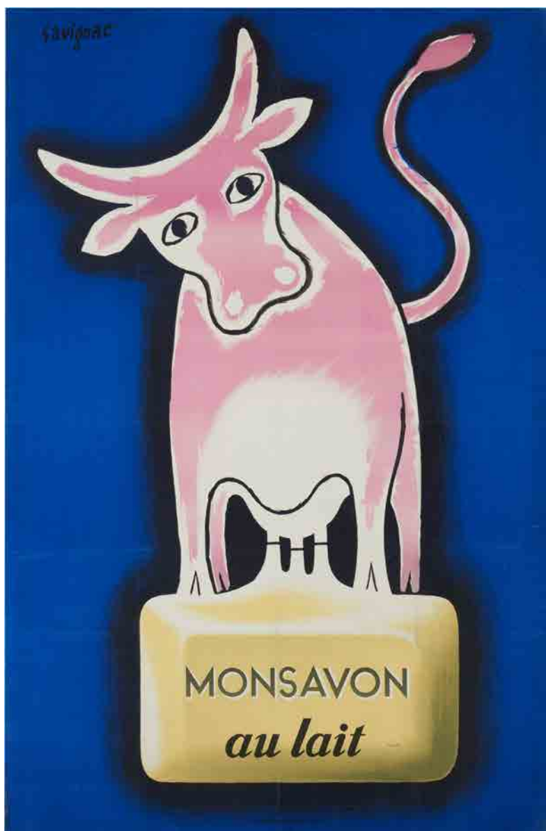
①《牛乳石鹸モンサヴォン》1948/50年 パリ市フォルネー図書館所蔵