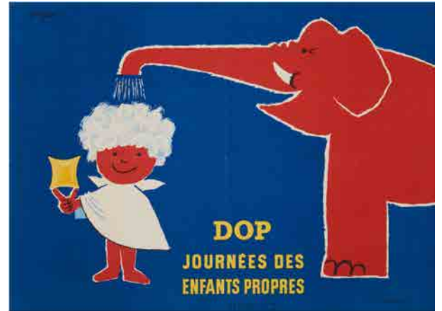
⑧《ドップ：清潔な子どもの日》1954年、パリ市フォルネー図書館所蔵