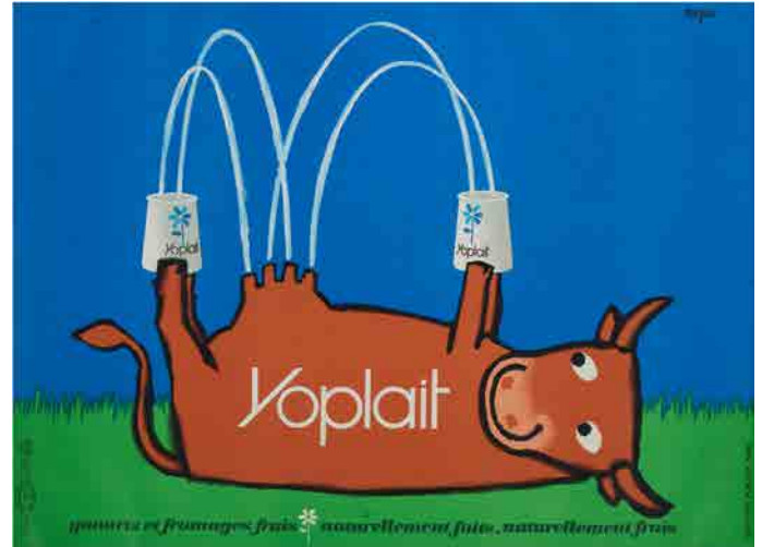
⑤《ヨープレート》1965年、パリ市フォルネー図書館所蔵 © Annie Charpentier 2018

パリ市フォルネー図書館の協力の下、大きいもので約3×4メートルにもおよぶポスターの来日を実現しました。リトグラフの技法で作られた当時のポスターは、現代の印刷物では味わうことのできない鮮やかさや風合いがあります。パリの街角のポスターに、約半世紀のときを超えて出会う喜びを堪能してください。