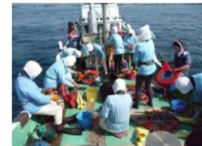
ノリアイ(志摩市志摩町)