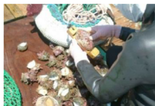
アワビの大きさの確認

海女は、獲物が採れる場所などを、選り抜く目を持っています。例えば、船の上から島や山の位置を見て潜る場所を判断し、ブイの流れを見て、潮の流れを読み取って