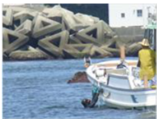
トリカジでの作業