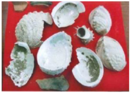
白浜遺跡の出土遺物

鳥羽市浦村の白浜遺跡から、アワビの貝殻などが出土しています。アワビは海に潜らないと採れないので、素潜り漁があったのではないかと考えられています。