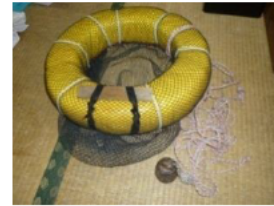
タンポ(浮輪付きの網袋)