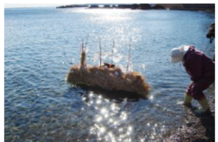
ノット正月（鳥羽市国崎町）