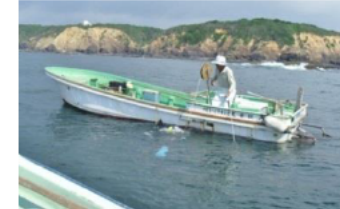
フナド(鳥羽市相差町)