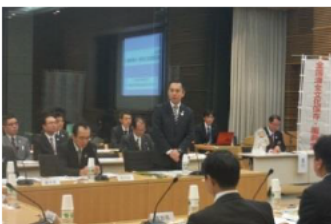
会議での鈴木英敬三重県知事

三重県は、海女漁の文化財保護、漁業振興、観光振興に積極的に取り組んでいます。伝統的な漁業である海女漁は、再生可能な漁法として、再認識されています。三重県教育委員会は、『海女漁技術は、鳥羽・志摩にとどまらず、日本の漁撈生活の推移の理解のために欠くことのできないもの』と考え、平成26年1月に県無形民俗文化財に指定しました。平成29年3月には、「鳥羽・志摩の海女漁の技術」として、国重要無形民俗文化財に指定されました。今後も、海女漁のユネスコ無形文化遺産登録を視野に、取組を進めていきます。