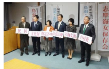
国文化財指定答申後の模様