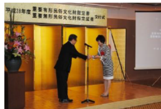
国文化財指定証書の交付

お問い合わせ 三重県教育委員会 社会教育・文化財保護課 〒514-8570 三重県津市広明町13番地 TEL 059-224-3328 FAX 059-224-3023 ホームページ URL ; http://www.bunka.pref.mie.lg.jp/bunkazai/ フェイスブック https://www.facebook.com/守ろう-活かそう-三重の文化財三重県教育委員会-社会教育文化財保護課-16358667370087/