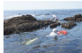
カチド(志摩市志摩町)

男女の組み合わせ(夫婦、親子)で、船に乗り込み、男性が滑車を使って綱で女性を引き上げるなどの共同作業で漁を行うものです。現在、最も少ない方法となっています。