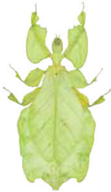
木の葉に擬態する! コノハムシ

現在知られている生物の中で、もっとも種の多様性が高い昆虫類。色、形、大きさや生態など、昆虫の多様な世界を紹介するとともに、近年博物館に寄贈された膨大な標本数のコレクションや、県内の昆虫に関する活動団体についても紹介します。