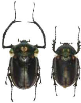
進化の過程で雄の前脚が伸びた! ヤンソニーテナガコガネの雌雄ペア