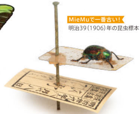
MieMuで一番古い! 明治39(1906)年の昆虫標本