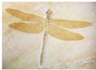
トンボ目の一種の化石(ジュラ紀)