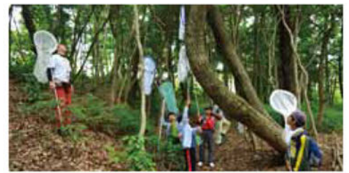
博物館での参加型昆虫調査の様子