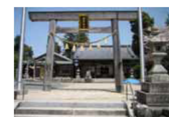
⑦椿岸神社 (市の指定無形民俗文化財の獅子舞が毎年10月に行われる)