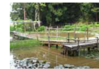
小さな生き物や緑いっぱい水生植物が繁茂しており憩いと安らぎの空間となっている。