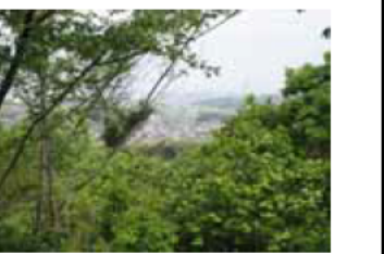
一生吹山 (市内が望め小公園となっている)

近鉄桜駅～伊藤酒造～石川酒造～智積養水～西勝寺～椿岸神社～大師堂～めだか池～一生吹山 (毘沙門天王)～近鉄高角駅 ※かに池は、近鉄桜駅より約2キロほど離れている。