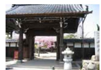
⑥西勝寺 (浄土真宗本願寺派、智積殿桜岡山西勝寺)