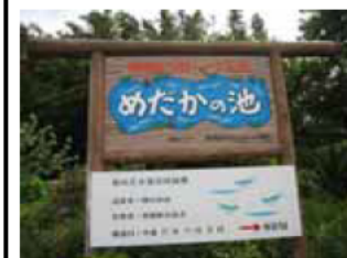
⑨メダカの学校 (初瀬ビオトープ) 智積自然の会によって美しいふるさとを次世代へ引き継ごうと整備された。