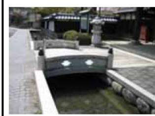
⑤智積養水 (地域住民の努力により鯉が棲む川に甦り、名水百選に選ばれている。)