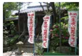
⑩一生吹山毘沙門天王 (智積有志の人々により勧請したという信貴山毘沙門天王が祀られている)