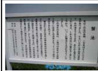
①かに池 (智積養水の水源となっている)