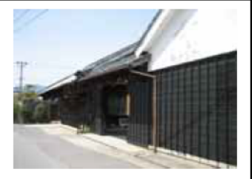
④石川酒造 (銘酒、噴井、花の井など) 明治後期の建物で長い黒塀は趣がある。山口誓子の句碑もある。