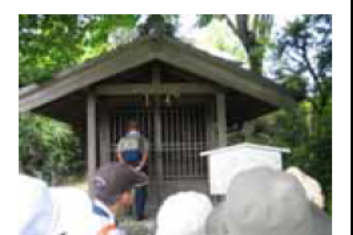
⑧大師堂 (弘法大師を祀る)