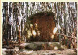
2 風の森社跡 風神を祀った社。「源平盛衰記」に源義経が戦勝祈願したとある。