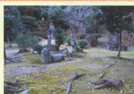
7 福地城跡・芭蕉公園 福地城跡に芭蕉公園を建設。中世末期の石垣、石蔵跡、井戸が残っている。県指定文化財。