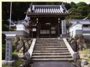
5 徳永寺 家康が伊賀越えの際に休息したお礼として田畑を与え、褒叙の使用を許したと言われる。藤堂藩主代々の施入文10通が残る。