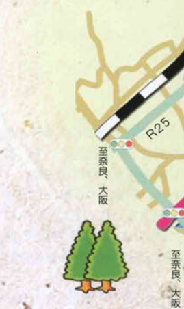
8 心学道場麗沢舎 江戸庶民の教育の場に開設された。県指定文化財。