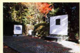
1 横光利一文学碑 横光利一がよく登ったという小さな丘に文学碑と川端康成の解説文碑が建つ。