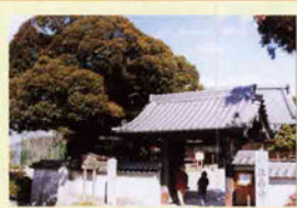
6 萬壽寺 芭蕉翁の菩提寺。本尊の延命地藏菩薩は国の重要文化財。