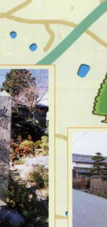
10 玉林寺 江戸時代の心学者堀田一之先祖の墓がある。