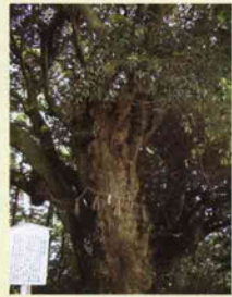
3 家康見張りの木 樹齢600年を超える椎の木。家康の部下がこの木で見張りをしたという説がある。