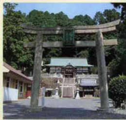
4 都美恵神社 寛文12年(1672年)に建立された参道入り口の石造り鳥居は市指定文化財。