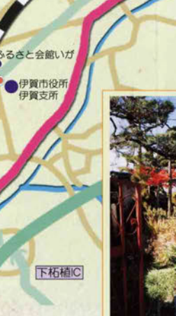
9 元柘植病院のレンガ塀 関西鉄道のトンネル用に焼かれたレンガの不良品を譲り受けて造られた。