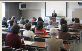
美術セミナー風景