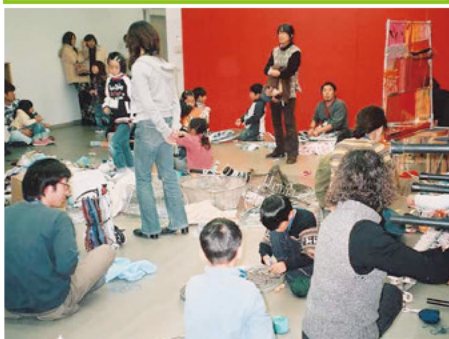
創作ひろば特別イベント「オリモノアート2005」風景

レストラン横の少し奥まったところに入出口のある、普段は目立たない部屋—それが美術体験室です。中は白っぽい壁と天井で囲まれ、一見よそよそしい印象を受けますが、それを和らげているのが、上方に取り付けられた窓から見える木々の色でしょうか。