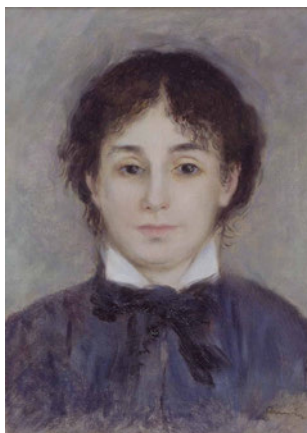
オーギュスト・ルノワール《青い服を着た若い女》 1876年頃 三重県立美術館蔵