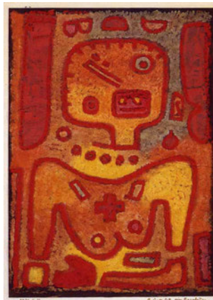
パウル・クレー《回心した女の墜落》1939年 愛知県美術館蔵