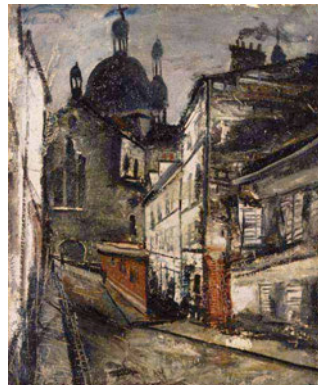
佐伯祐三《サンタンヌ教会》1928(昭和3)年

今回のこの展覧会は三重県立美術館の収蔵作品のなかから、1, 異国にて/画家のまなざし 2, 身の発見/日常の冒険 3, 空想/憧憬 4, 未知の世界へ という4つのセクションを設け、それぞれにふさわしい作品を選んで構成展示します。「つくる」という創造行為をふかめることによって生まれてくる、作家自身の体験をも超えた思いがけない別世界。この機会に是非「自分が変わるかもしれない」作品と出会ってください。(Ty)