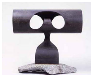
堀内正和《水平の円筒》1959(昭和34)年