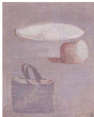
森芳雄《大根など》1942(昭和17)年