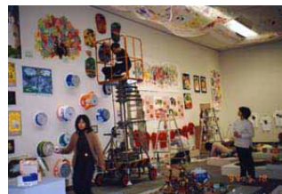
第3室・南勢地区及び盲・聾養護学校