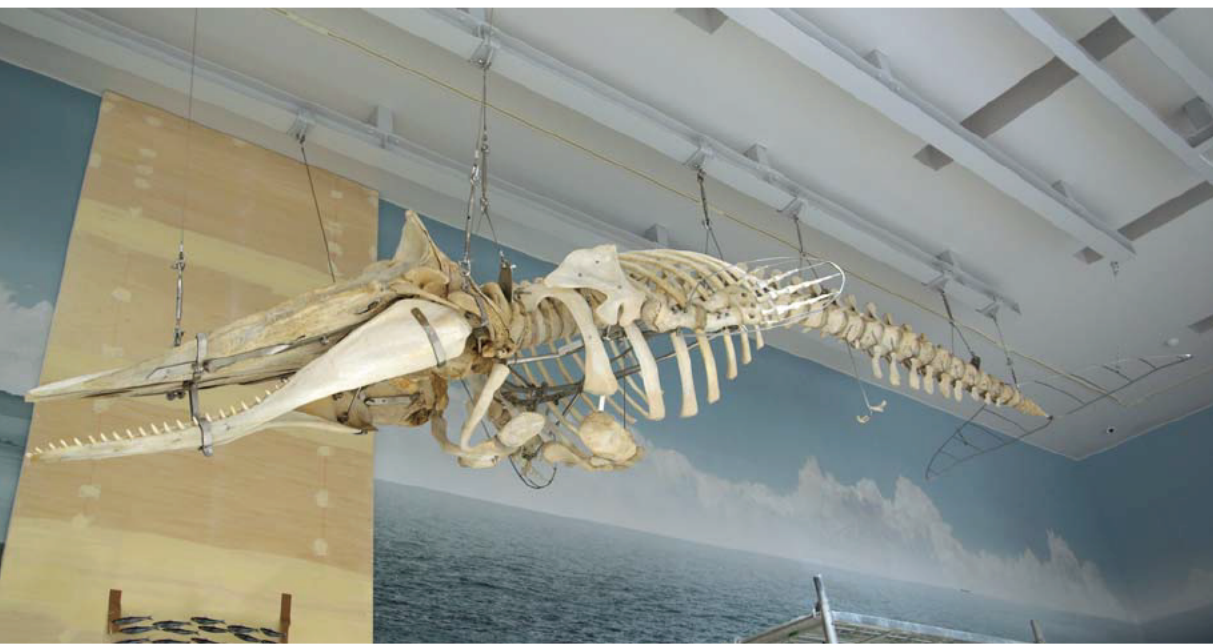
マッコウクジラの全身骨格標本

新しい県立博物館である三重県総合博物館(MieMu(みえむ))の開館までいよいよ100日となりました。現在、館内では展示工事が急ピッチで行われています。