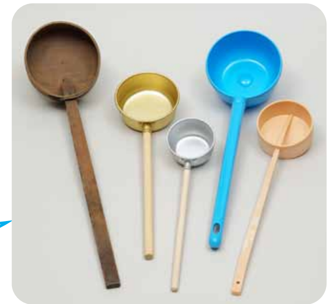
ひしゃく さまざまな柄杓