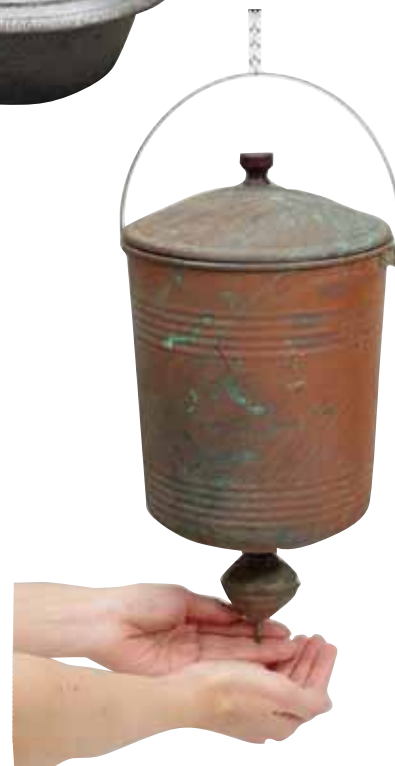
てあらいき 手洗器