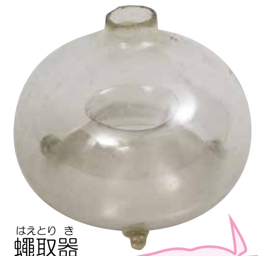
はえとりき 蠅取器