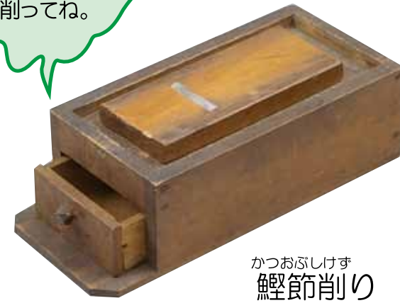
かつおぶしけず 鰹節削り