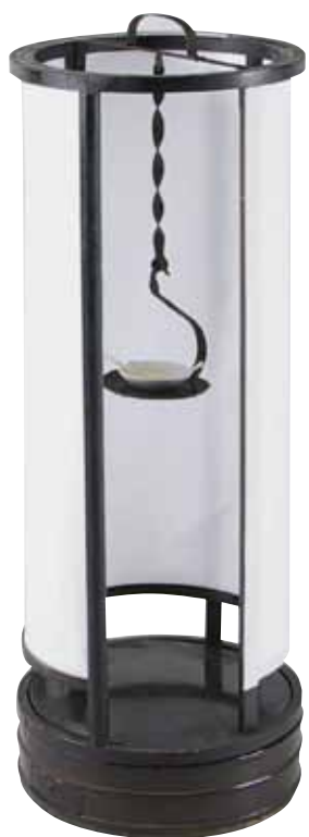
まるあんどん 丸行燈