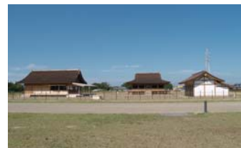
「사이쿠 헤이안의 숲」 내의 복원 건물 사진 왼쪽부터 서협전, 정전, 동협전. 정전은 의식 등을 행한 상징적인 건물

사이쿠역의 북동쪽에는 중요한 의식 등을 진행했던 3동의 복원 건물을 포함하여 사이쿠의 중심적인 부분을 정비한 사적 공원 「사이쿠 헤이안의 숲」이 2015년 가을에 오픈했습니다.