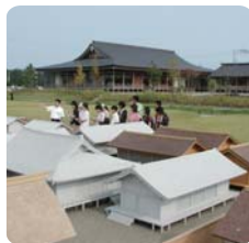
1/10 사적 전체 모형 뒤쪽 건물은 이츠키노미야 역사체험관