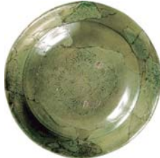
녹색 유약 도기 음각 꽃무늬 그릇 【중요문화재】

사이오는 미혼의 황녀 중에서 점괘를 통해 정해졌으며, 궁중의 소사이인(初齋院)이나 노노미야(野宮) 등에서 햇수로 3년간 몸과 마음을 깨끗하게 하기 위해 절제된 생활을 한 후 사이쿠로 떠납니다. 군행이라고 불린 이 여행은 헤이안 시대에는 오우미에서 스즈카의 산들을 넘어 이세국에 도달하는 5박 6일에 걸친 여행이었습니다. 7세기 후반에 텐무 천황에 의해 제정된 이 사이오 제도는 약 660년간 지속되었고, 사이쿠는 9~10세기에 걸쳐 가장 융성했던 시기를 지나, 14세기 중반 남북조의 동란 중에 그 모습을 감추게 됩니다.