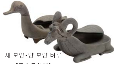
새 모양·양 모양 버루 【중요문화재】