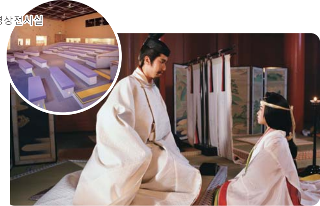
「사이오 군행」의 한 장면

사이오의 의례와 수도에서 이세로 향하는 여행을 재현한 「사이오 군행」, 그리고 사이쿠 유적의 발굴 성과를 바탕으로 헤이안 시대의 사이쿠의 모습을 재현한 「지금 여기 되살아나는 환상의 궁」이라는 두 편의 영상을 상영하고 있습니다.