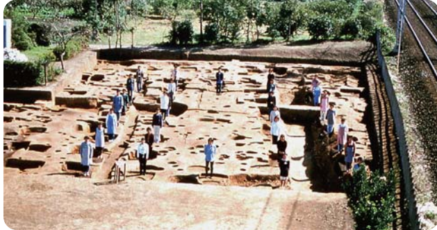
사이쿠 유적 제119차 조사 (사람이 서 있는 곳이 건물의 기둥이 있던 곳)

사이쿠 유적은 국가가 지정한 사적으로, 동서 2km, 남북 700m에 달하는 137ha가 그 범위로 지정되어 있습니다.1970년부터 본격적으로 개시된 조사는 현재까지도 계속 진행되고 있습니다. 사적의 동부에서는 헤이안 시대 초반의 동서 7구획, 남북 4구획으로 이루어진 바둑판 모양의 반듯하고 가지런한 구획이 확인되었고, 사이오가 생활했던 내원의 조사도 진행되어, 주요한 출토품은 중요문화재로 지정되어 있습니다.