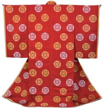
우치기 (귀부인이 당의에 받쳐 입던 옷)