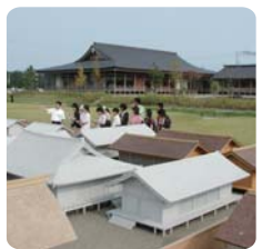
1/10史跡整體模型 後方的建築物是itsukinomiya 歷史體驗館