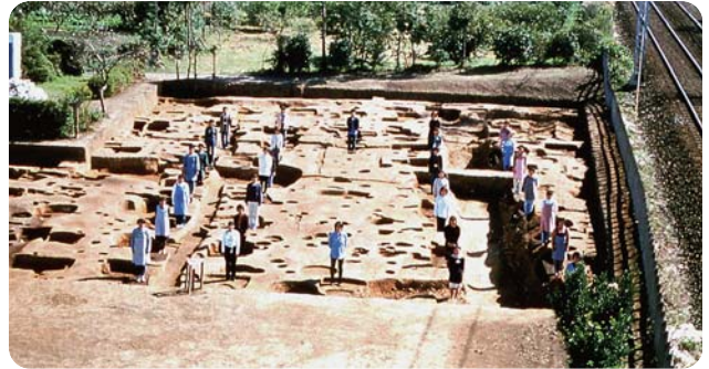
齋宮遺跡第119次調查(人站立之處為建築物的棟樑遺跡)

齋宮遺跡是國家指定的史跡，範圍橫跨東西2km、南北700m，面積共137公頃。於昭和45年(1970)正式開始調查，現仍繼續進行中。在史跡的東部，除了發現起源於平安時代的東西7個區域、南北4個區域的棋盤狀整齊區劃，對於齋王的居所(內院)所進行的調查也有進展(內院)，主要的出土物品被指定為重要文化財產。