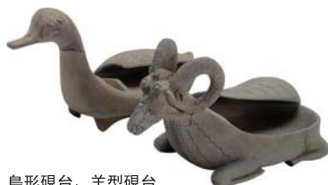
鳥形硯台、羊形硯台 【重要文化財產】