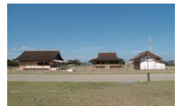
「齋宮平安之杜」內的復原建築物 照片由左為西脇殿、正殿、東脇殿。 正殿是舉行儀式等的象徵性建築物

齋宮站的東北方，有由包含昔日舉行重要儀式的3棟復原建築物在內之齋宮的主體部分整修而成的史跡公園「齋宮平安之杜(日文的「杜」有森林之意)」。平成27年(2015)秋天開始開放參觀。