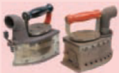
炭火アイロン (明治)