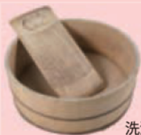
洗濯板とたらい (昭和)