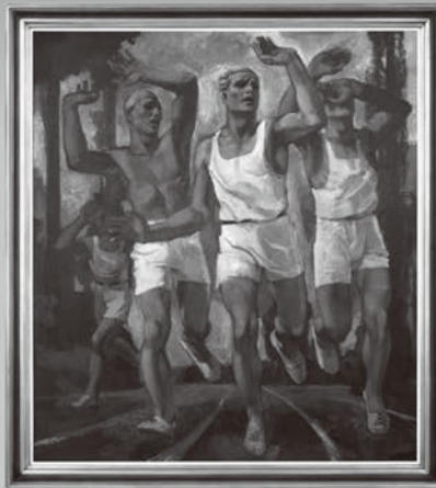
《ゴールするランナーたち》

本展覧会は、2020年の東京オリンピック・パラリンピックへ向け、皆様に夢と希望を届けるべく企画しました。日本唯一の総合スポーツ博物館である秩父宮記念スポーツ博物館所蔵のお宝を中心に、1964年の東京オリンピックをはじめとするスポーツシーンを彩った品々や、スポーツを題材にした芸術作品、三重県ゆかりのオリンピック・パラリンピックメダリストの活躍ぶりをご紹介します。