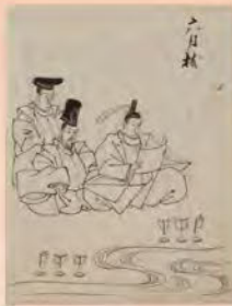
年中行事 江戸時代