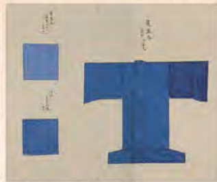
装束図巻 江戸時代