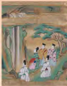
伊勢物語図色紙 「布引の滝」 江戸時代