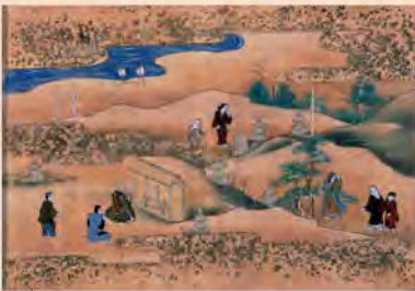
奈良絵本 西行物語絵巻 江戸時代