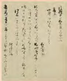
後拾遺和歌集 江戸時代

平安時代における季節としての「夏」と、平安時代の人びとが、実際に「暑い」と感じる夏から秋にかけての行事などを貴族の日記、古典文学、絵画資料などでたどりながら、平安時代の人びとと暑い季節のつきあい方を紹介します。