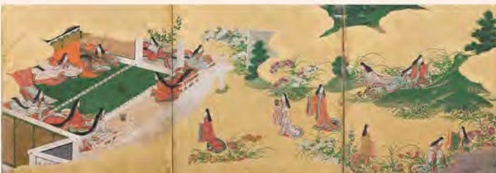
源氏物語図屏風 江戸時代