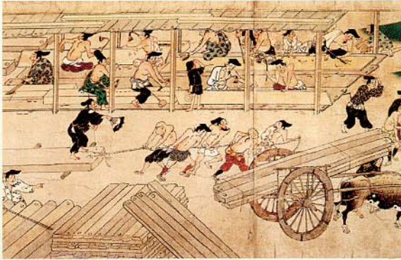
▲重要文化財 石山寺縁起絵巻 巻一 鎌倉時代 石山寺蔵 ※展示期間 9/26 ~ 10/25