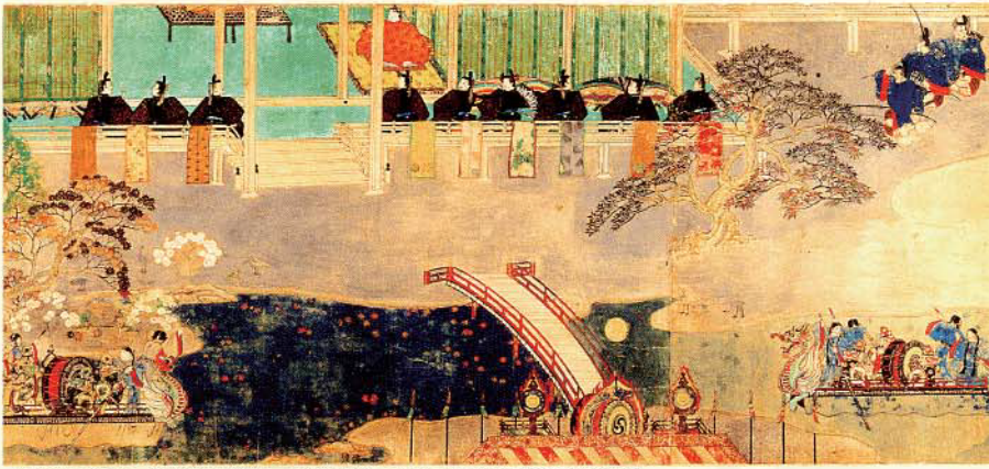
▲重要文化財 駒競行幸絵巻 鎌倉時代 和泉市久保惣記念美術館蔵 ※展示期間 10/14 ~ 10/25 (期間中場面替えを行います)

平成27年秋、齋宮跡に初めて復元される三棟の平安時代の建物。齋宮の役所「齋宮寮」の長官のもとで、儀式や饗宴に使用されたと考えられます。これら平安時代の建物の背景には、寝殿造に代表される古代建築の世界が広がります。そして、正殿やその前庭で、都同様に繰り広げられた齋宮の官人たちの活動も見えてきます。古代建築の魅力伝え、いにしへの齋宮のすがたを再現する展覧会です。