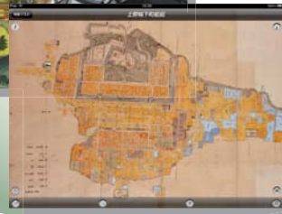
【上野城下町絵図】 正徳 5 年 (1715 年) : 推定