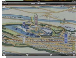
【上野市 (上野市鳥瞰図)】 昭和 17 年 (1942 年)