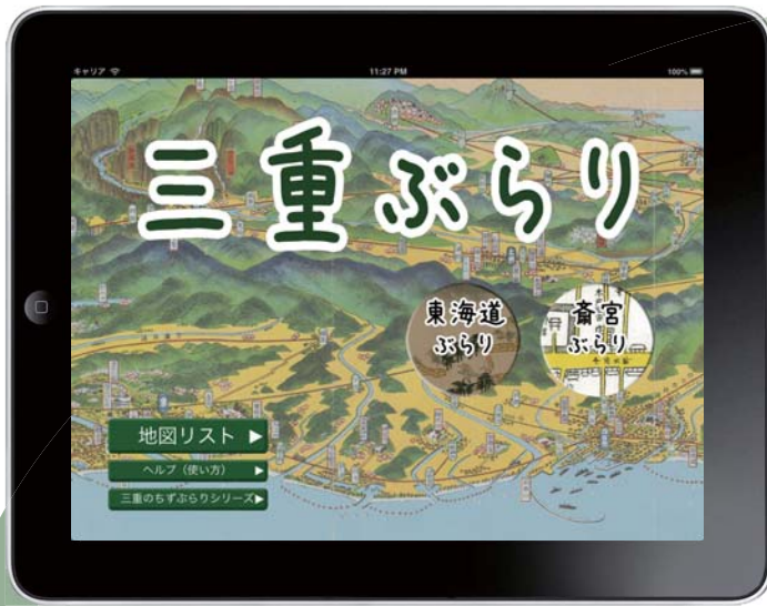
iOS 版の画面イメージ