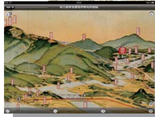
【初三郎参宮要覧伊勢名所図絵】 大正 8 年 (1919 年)