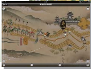
【東海道分間絵図】 江戸時代