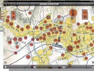
【實地踏測 参宮案内地圖】 大正 6 年 (1917 年)