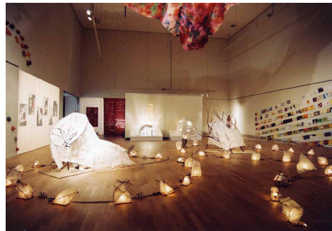
第4室「光と影」特別展示風景(照明光による)

毎週日曜日(除1月30日) 午後2時～ 年中児以上～小学4年生以下、20人以内 申込みは当日エントランスホールにて 参加費：無料