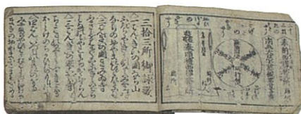
三重県総合博物館蔵