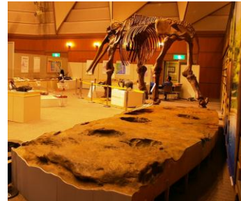
ミエゾウ足跡化石展示イメージ