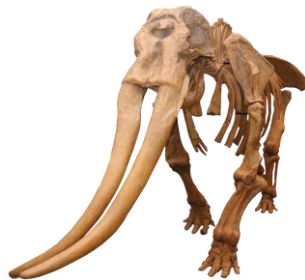
コウガゾウ全身骨格標本