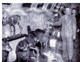
昭和天皇行幸時の写真：剥製は県博で収蔵