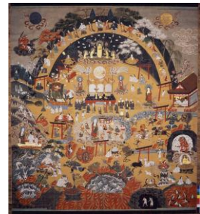
熊野観心十界曼荼羅