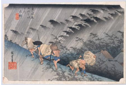
歌川広重 東海道五十三次ノ内 庄野