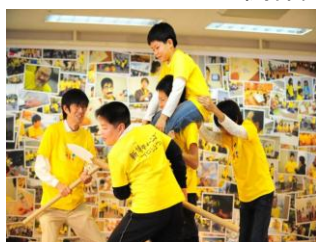
新博ティーンズプロジェクト