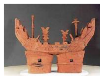
宝塚1号墳 船形はにわ