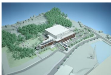
新県立博物館模型

【主な資料】現博物館の活動写真、新県立博物館の建築・展示製作の検討にかかる模型・資材・ 材料検討資料、ティーンズプロジェクト関係資料ほか