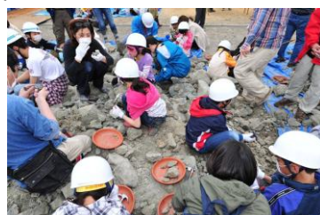
みんなで見つけた建設地の化石