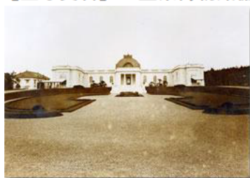
戦前の神宮徴古館

【主な資料】三重県博物館協会加盟の各館園の創立に関わる資料や特徴をあらわす資料ほか