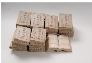
地租改正反対一揆関係簿冊