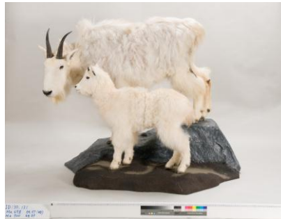
世界のカモシカより シロイワヤギ