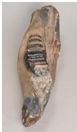
ミエゾウ明(あきら)標本

【主な資料】ミエゾウ明(あきら)標本(実物)、古琵琶湖層群産巨大足跡群(15×5.6m)、コウガゾウ等の全身骨格、全国産出のミエゾウなど化石ほか